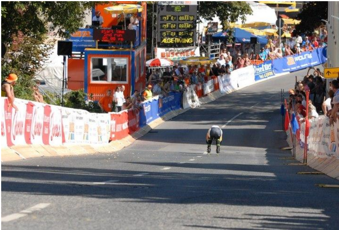
Moritz Nörl im Zielschuss